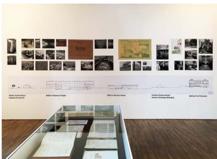
Exposição FAU 70 anos, Doc. no 1, assinado por Abelardo de Souza, Helio Queiroz Duarte, João V. Artigas e Rino Levi

A exposição FAU 70 anos nasceu de uma ideia de funcionários técnico-administrativos da Faculdade de Arquitetura e Urbanismo da Universidade de São Paulo, que reconheceram na efeméride uma oportunidade imensa para apresentar e reiterar a importância e trajetória da FAU por meio de seus documentos. Tais documentos revelaram a Faculdade por dentro, seus meandros administrativos, as decisões de seus dirigentes, as demandas de seus alunos, apresentando os caminhos, os desvios e os constantes desafios.