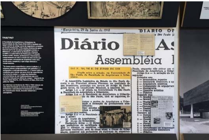
Exposição FAU 70 anos, recorte de jornal com Lei n. 104, de 21 de junho de 1948, que cria a FAU USP

Fundada em 1948 a partir do antigo curso de engenheiro-arquiteto da Escola Politécnica, alunos, professores e funcionários comprometiam-se naquele momento com a criação de uma escola que via a formação de arquitetos como uma tarefa nova, complexa, exigindo sínteses e compromissos.