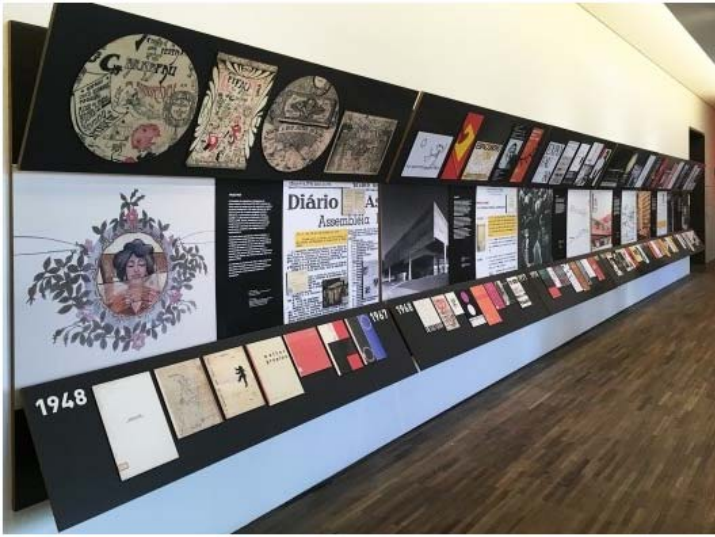
Exposição FAU 70 anos, linha do tempo

As relações da escola com a sociedade se expressam em todos esses objetos, e ganham dimensões mais tensas nos processos administrativos, documentos e obras de arte, ao revelarem também as práticas autoritárias e ditatoriais se movimentando dentro de um espaço que se propõe democrático e comprometido com transformações sociais de caráter progressista.