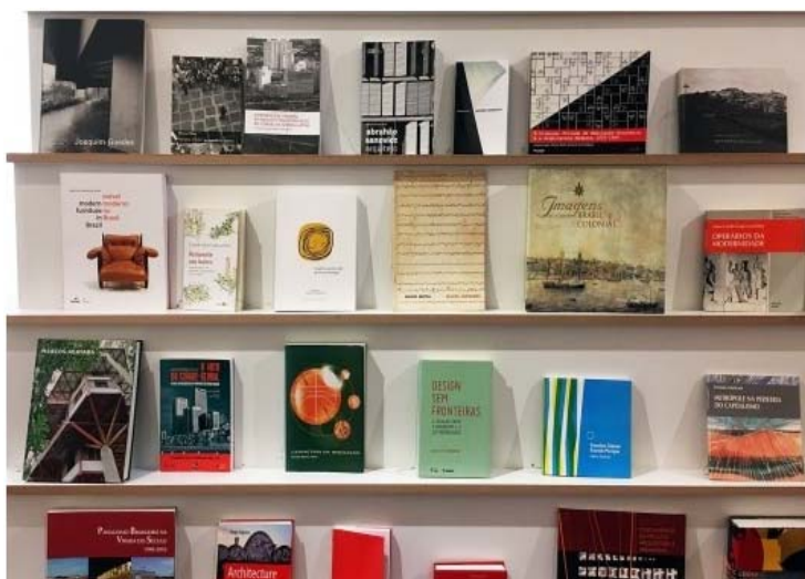
Exposição FAU 70 anos, estante com livros de autoria de professores da escola

A primeira sala abriga fundamentalmente os processos internos da faculdade. Seus edifícios são espaços que têm significado, porque preenchidos por práticas que os transformam em lugar da formação universitária. A produção de alunos e professores – expressa em livros e revistas, cadernos e desenhos de estudo, obras de artes visuais e mobiliário – expressa a pesquisa como inquietação permanente dos fazeres do arquiteto, urbanista e designer formado pela FAU.