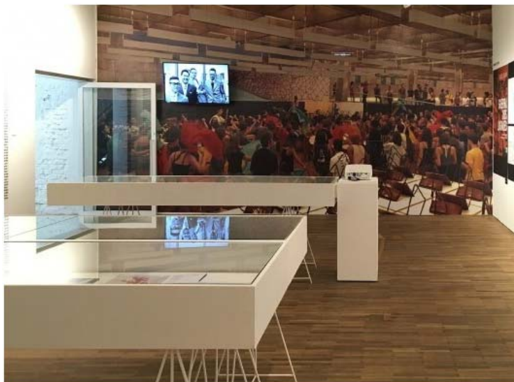
Exposição FAU 70 anos, sala com vídeos, fotos e produção premiada de professores da escola

A permanente necessidade de adequação dos espaços às demandas acadêmicas e administrativas, aliada aos problemas de conservação de um edifício com quatro décadas fazem com que a FAU passe por um longo e conturbado período de reformas no início do século 21. As discussões e mobilizações levam à realização de um Plano Diretor Participativo e à criação de um escritório oficina-acadêmico. Reafirma-se a vocação do prédio e da escola como lugar de experiências diversas e plurais, com múltiplos usos.