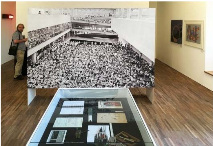
Exposição FAU 70 anos, display com documentos e painel com foto histórica de manifestação no Salão Caramelo

A pesquisa sobre a produção arquitetônica realizada no programa de Pós-graduação – cuja atuação contribui para o início de um amplo processo de revisão da historiografia da arquitetura e do urbanismo no Brasil – vale-se também da grande quantidade de doações de acervos de arquitetos ocorridas neste período.