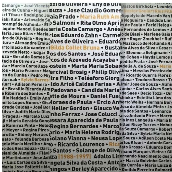
Exposição FAU 70 anos, trecho do painel com nomes de professores e funcionários da escola ao longo dos anos

A exposição propõe o exercício de reconhecimento de uma trajetória, de um projeto reafirmado e em transformação permanente. Não à toa, o livro com as imagens dos professores-alunos faz tanto sucesso.