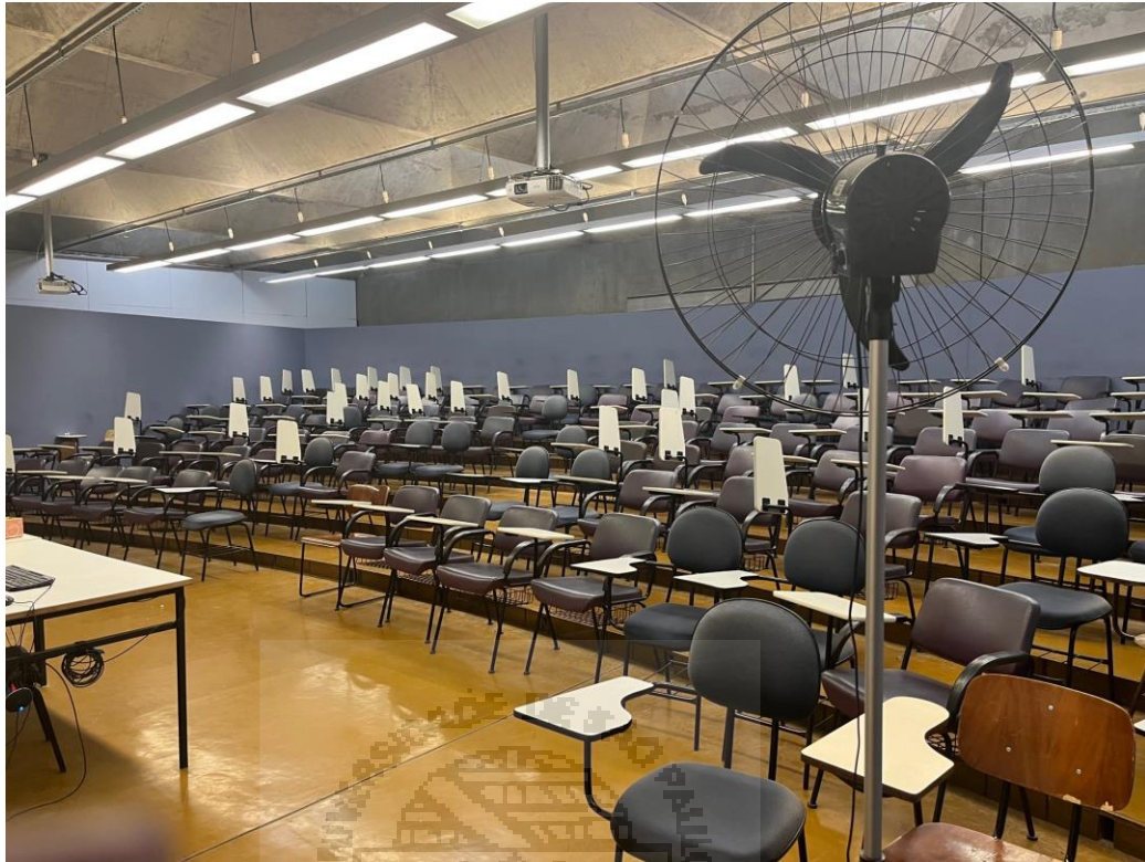
Imagem 01: Sala 807